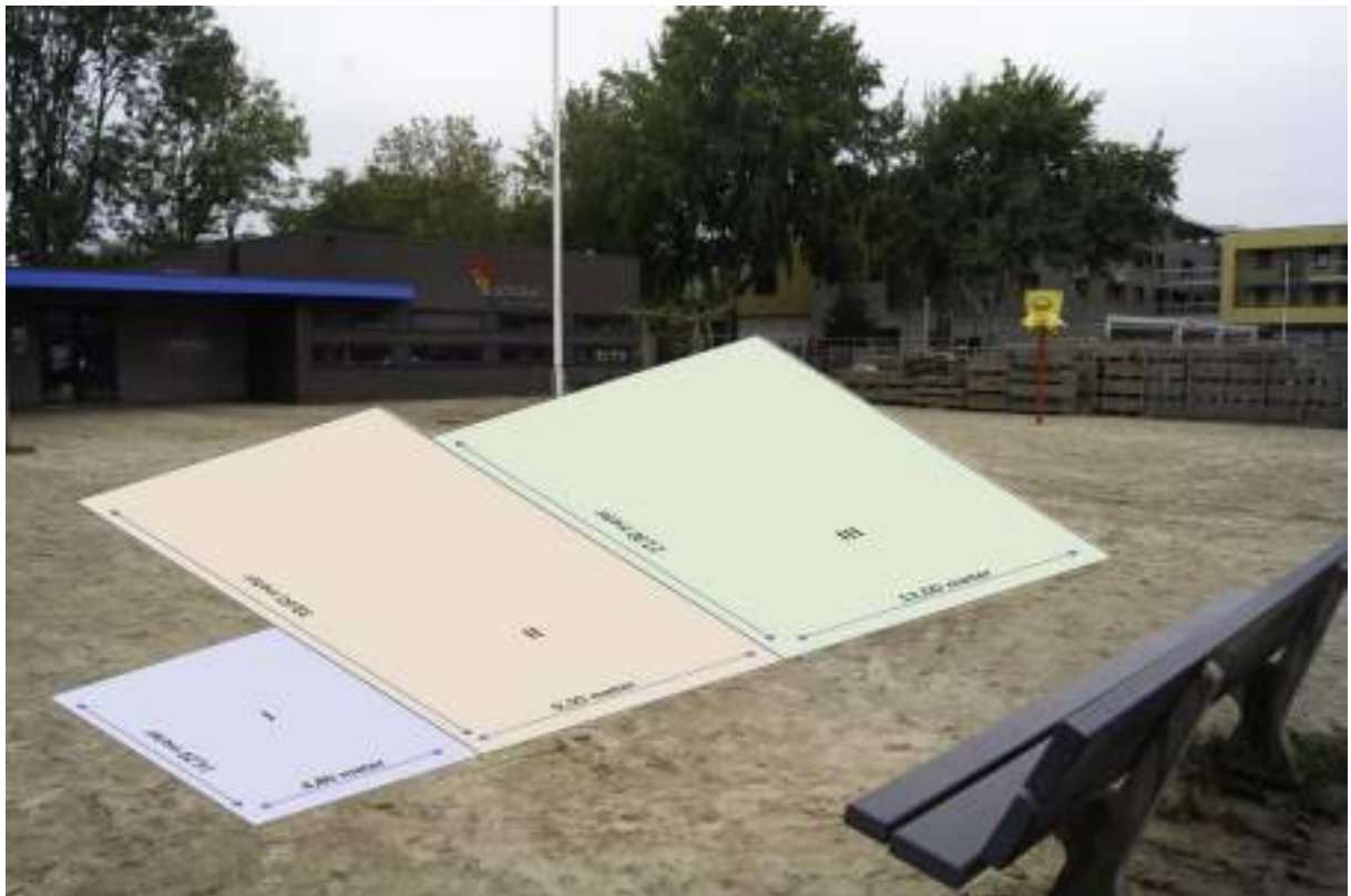
Foto vergroten helpt om de maten te lezen. Voor de zekerheid: de eerste strook is 4,8 meter breed en 16,2 lang. De tweede: 9,3 bij 33,6. De derde: 12,0 bij 27,3 meter.

Een tegel is een tegel, toch? Nou, dat had je gedacht. Er zijn dikke, hele dikke en dunne tegels. Toch komen ze allemaal in één oppervlaktemaat. De lengte van zo'n tegel is 30 centimeter, de breedte ook diezelfde 30 centimeter. Natuurlijk zitten er dunne voegen tussen de twee tegels, gevuld met zand, maar wij doen even net of die voegen niet bestonden. Het hele plein was dus een-en-al tegel.